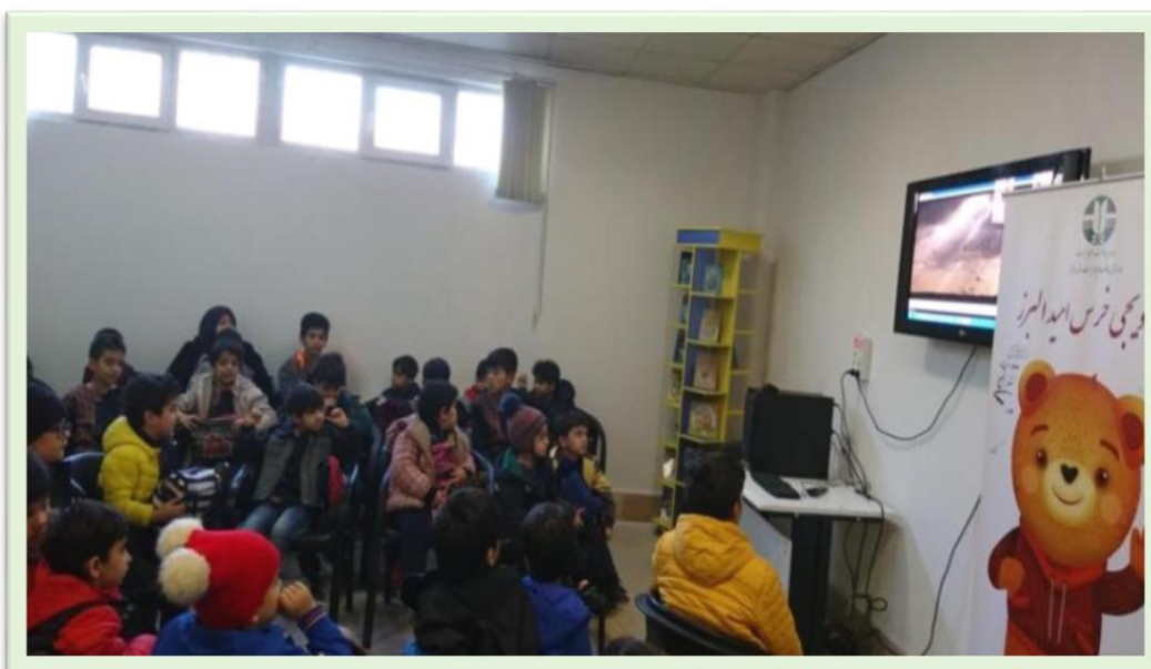
ارائه آموزش از طریق بخش فیلم و کلیپ؛ در بخش آموزش‌های محیط‌زیستی موزه تاریخ طبیعی و تنوع زیستی