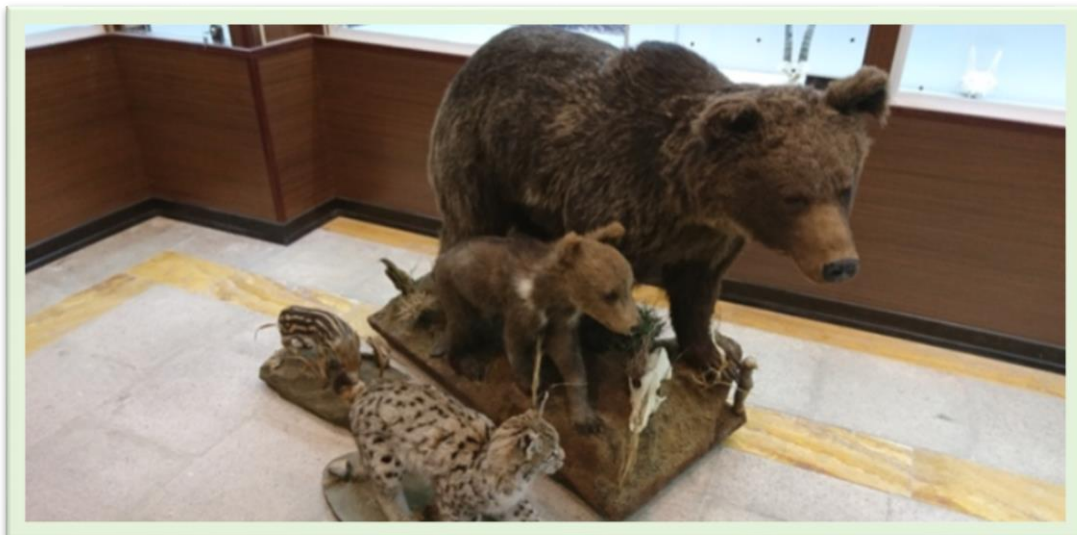
الحاق نمونه‌های جدید از گونه‌های شاخص استان البرز به مجموعه موزه تاریخ طبیعی و تنوع زیستی