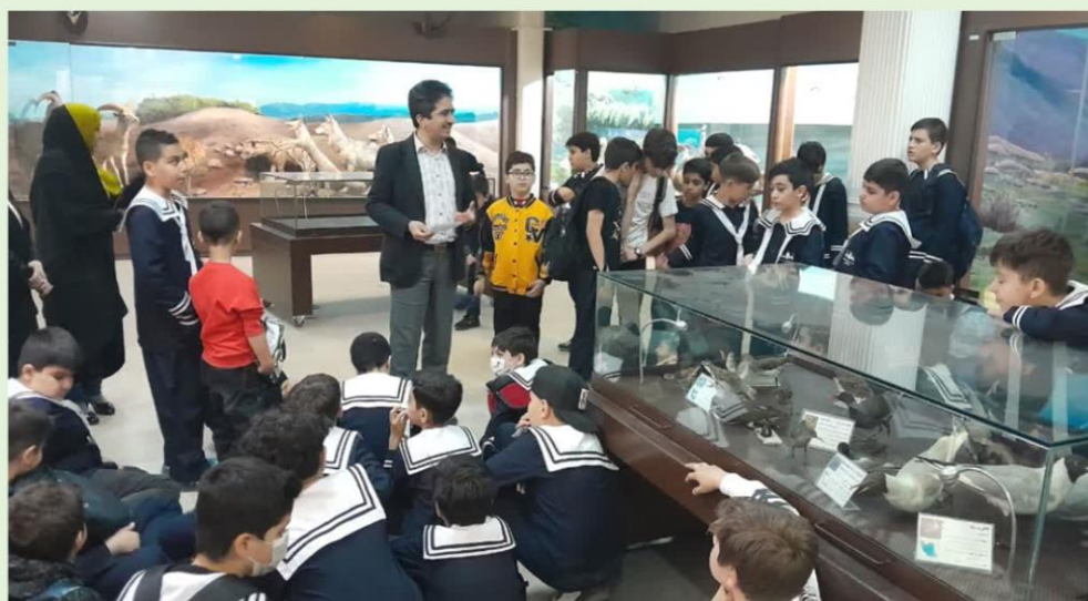
ارائه آموزش در مجموعه موزه و پخش فیلم و کلیپ؛ در بخش آموزش‌های محیط‌زیستی موزه تاریخ طبیعی و تنوع زیستی