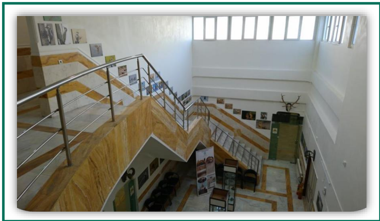
نمایی کلی از ساختمان و مجموعه موزه تاریخ طبیعی و تنوع زیستی

این موزه شامل غرفه‌های متعددی از جمله غرفه پستانداران، پرندگان، خزندگان، آبزیان، گیاهان و ... می‌باشد که در آن گونه‌های مختلف و شاخص از قبیل پلنگ، خرس قهوه‌ای، کل و بز، عقاب و ... برای آشنایی اقشار مختلف جامعه به ویژه دانش‌آموزان، دانشجویان، متخصصین و علاقه‌مندان به محیط‌زیست کشور به نمایش گذاشته شده‌است. موزه تاریخ طبیعی