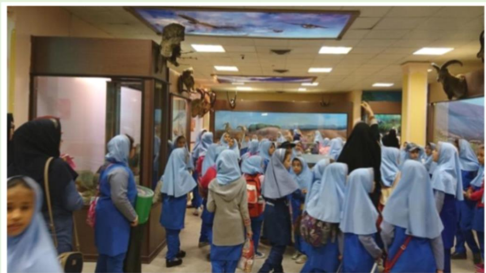
استقبال چشمگیر و پرشمار دانش‌آموزان از موزه تاریخ طبیعی و تنوع زیستی