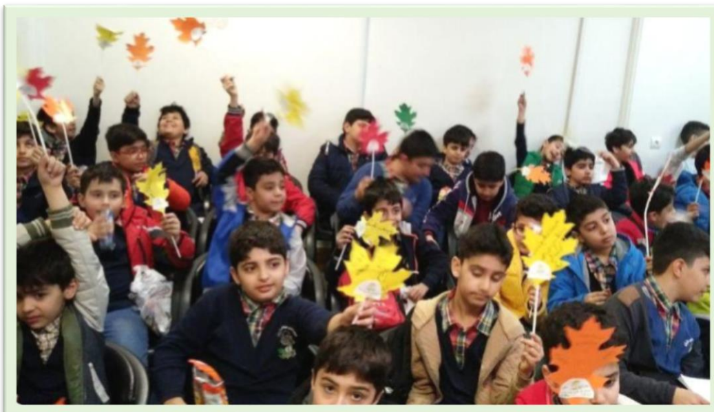
استقبال دانش‌آموزان از موزه تاریخ طبیعی و تنوع زیستی به مناسبت روز و هفته درختکاری

موزه تاریخ طبیعی و تنوع زیستی اداره کل حفاظت محیط‌زیست استان البرز در طی این مدت، به منظور آشنایی عموم با تنوع زیستی استان و اهمیت آن و متعاقباً افزایش سطح آگاهی و گرایش عموم به سمت حفاظت از اجزای تنوع زیستی، اقدام به آموزش عموم مردم، به‌ویژه گروه‌های دانش‌آموزی درمقاطع