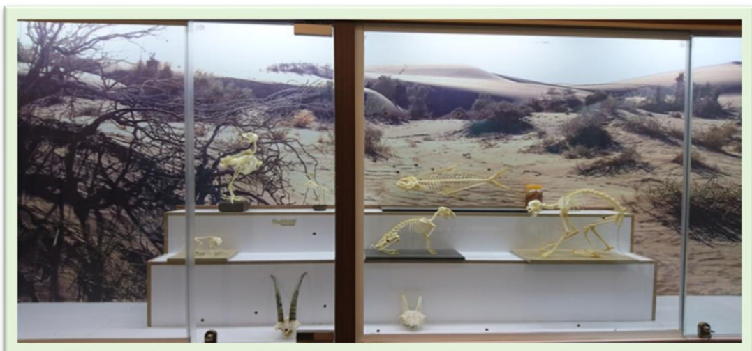
افزودن نمونه‌های اسکلت به مجموعه موزه تاریخ طبیعی و تنوع زیستی