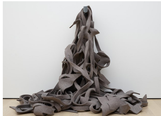
تصویر ۶: رابرت موریس، بدون عنوان (گره ۴۶ )، ۱۹۶۷، نمد، حدوداً ۳ × ۷/۲ × ۵/۱ متر (Robert Morris, Untitled "Tangle", 1967)

هسه ۴۱ نمونه بارزی از به‌کارگیری مواد نرم و شکل‌پذیر است. او شهرت زود هنگام خود را مدیون استفاده از مواد نامتعارف در مجسمه‌سازی است؛ موادی همچون لاتکس، پارچه تنظیف ۴۲ طناب، نخ و لوله لاستیکی (Collins, 2007: 11). در این زمانه است که ماده، اوج می‌گیرد و موجب تحول رسانه می‌شود. یا حتی برای لحظاتی، خودش تبدیل به رسانه می‌شود. در اثری از اندی وارهول ۴۳ این مسئله را می‌توان به خوبی دید؛ بادکنک‌هایی بزرگ از جنس مایلار ۴۴ که با هلیوم پر شده‌اند. این مجموعه بادکنک‌های بالشتی شکل با جریان هوایی که مخاطبین ایجاد می‌کردند در فضای گالری حرکت می‌کرد (همان: ۱۰). اثر مذکور را می‌توان نوعی نرم‌سازه ۴۵ متحرک یا چیدمانی تعاملی برشمرد که درونمایه‌اش از مواجهه مستقیم مخاطب با ماده شکل می‌گیرد (تصویر ۷).