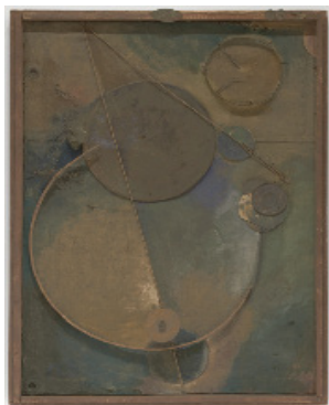
تصویر ۴: کورت شوپترز، دوار ۱۴ ، ۱۹۱۹، چوب، کاموا، چرم، توری و رنگ روغن (Kurt Schwitters, Revolving, 1919)

اثر مرتزبائوی این هنرمند را می‌توان اولین چیدمان ۱۱ تاریخ هنر به حساب آورد و نقطه شروع اشتیاق روزافزون به چیدمان است؛ هنری که در آن یک شیء یکپارچه و واحد، به نفع تلفیق و ترکیب، کنار می‌رود و فضای زمین و دیوار به آن هویت می‌بخشد. به نظر می‌رسد رواج هنر چیدمان نیز بر تحول در استفاده از مواد تأثیر داشته است؛ چراکه با گذار از ایده مجسمه روی پایه و گسترش فضایی که مجسمه در آن قرار می‌گیرد، ماده که تابع فضا است نیز دچار تغییر می‌شود. بعدها اصطلاح شیء یافته شده ۱۲ از دل جنبش سورتالیسم ۱۳ شکل گرفت که نشان می‌داد؛ هنرمند می‌تواند در دوران مدرن به انتخاب یا گردآوری اشیاء بپردازد و لزوماً موظف نیست از صفر تا صد اثر را خودش بسازد.