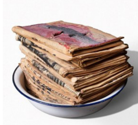
تصویر ۹: آنتونی تاپیس، دسته روزنامه، ۱۹۷۰، روغن، چسب شن روی روزنامه در کاسه فلزی (Antoni Tàpies, "Pile of Newspapers")

در بسیاری از آثار، ماده به طور ضمنی، معنایی استعاری یا مجازی در خود دارد که مورد نظر هنرمند بوده است تا بتواند از طریق مجسمه، جهان‌بینی و تعبیر مخاطب را به خود نزدیک گرداند. در این رابطه می‌توان به اثری با عنوان برهنه شماره ۱۸ از سارا لوکاس ۴۲ اشاره کرد که با استفاده از ساپورت کشی پُر شده با الیاف، ساخته شده و بر روی یک پایه بلند نصب شده و تا ارتفاعی در حدود راستای چشم انسان بالا آمده است (تصویر ۱۰).