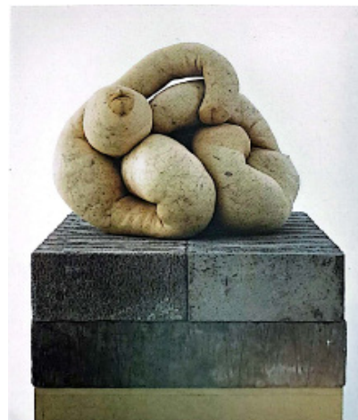
تصویر ۱۰: سارا لوکاس، برهنه شماره ۱۸، ۲۰۰۹، ساپورت کشی پُر شده با الیاف (Moszynska, 2013: 29)

در بسیاری از آثار، ماده به طور ضمنی، معنایی استعاری یا مجازی در خود دارد که مورد نظر هنرمند بوده است تا بتواند از طریق مجسمه، جهان‌بینی و تعبیر مخاطب را به خود نزدیک گرداند. در این رابطه می‌توان به اثری با عنوان برهنه شماره ۱۸ از سارا لوکاس ۴۲ اشاره کرد که با استفاده از ساپورت کشی پُر شده با الیاف، ساخته شده و بر روی یک پایه بلند نصب شده و تا ارتفاعی در حدود راستای چشم انسان بالا آمده است (تصویر ۱۰).