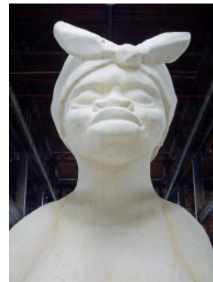
تصویر ۱: کارا واکر، ظرافت ۱۵ ، ۲۰۱۴، بخشی از چیدمان، پلی‌استایرن و شکر (Walker, 2014)

را جمع می‌کرد و تصادفی روی بوم می‌چسباند و به عنوان وصله چسبانی ۱ ارائه می‌کرد و یا در سازه مرتزبائو ۲ اشیاء را بر اساس ساختار سه‌بعدی آنها گردآوری کرده بود. اثر اخیر که امروزه فقط عکس‌ها و نسخه‌ای بازسازی شده از آن به جا مانده است، نوعی معماری کلاژ و فضابندی انتزاعی بود که با زباله و قراضه‌ها برپا و تزئین شده بود. شوپترز در سال‌های ۱۹۲۴ تا ۱۹۳۷ سه سری اجرا با این روش انجام داده است. او در سازه‌های خود حفره‌ها یا غارهای کوچکی احداث، و هر یک را به نام دوستی اختصاص می‌داد و لباس‌هایی فرسوده و اشیائی غیر هنری و بی‌نام و نشان که مطابق با آرمان داداییسم، پوچ و بی‌معنا بودند را در جای جای این حفره‌ها می‌افکند (فلدمن، ۱۳۷۸: ۳۳۲). شوپترز همچنین، پیکره‌هایی که با محتویات سبد خرده کاغذهایش ساخته بود را در قالب آثاری رسمی از هنر نوظهور عرضه نمود. او در کارهایش از مواد بسیار متنوعی همچون چرم، مقوا، سیم، کاموا، سنگ، فلز و گچ استفاده می‌کرد (تصویر ۴).