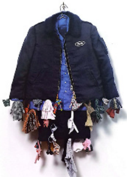
تصویر ۳: چارلز لهدری، چارلز ۱۰، ۱۹۹۵، پارچه، پلاستیک، رنگ و نخ، ۴۸ × ۳۵ سانتی‌متر (Charles-Ledray, 2025)

با اینکه شوپترز اغلب به عنوان نقاش شناخته می‌شود، رویکرد او سرآغاز التقاط در تمام رسانه‌های هنر است. آرمان او این بود که سازه‌هایش، شعر، معماری، نقاشی و نمایش را با یکدیگر درآمیزد (فلدمن، ۱۳۷۸: ۳۳۲).