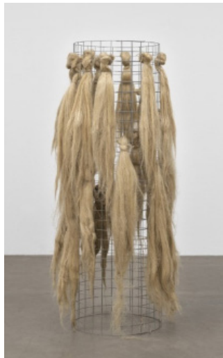
تصویر ۸: ماریسا مرز، بدون عنوان، ۱۹۶۶، کنف و فلز، ابعاد حدوداً ۵۹ × ۱۵۲ سانتی‌متر (Marisa Merz, Untitled, 1966)

مورخ هنر ایتالیایی جرمانو چلانت ۳۶ در کتاب خویش با عنوان هنر ناچیز (فقیر) ۳۷ که در آن آثار هنرمندان گروه ناچیز را مدون و مستند کرده است، می‌نویسد: «حیوانات، گیاهان و مواد معدنی به یکباره در دنیای هنر پدیدار می‌شوند» (به نقل از پارمزانسی، ۱۳۹۸: ۱۷۷). این گروه از هنرمندان قصد داشتند تا در جهت عکس هنر متعالی حرکت کنند و آگاهانه از کاربرد مواد فخم و عالی پرهیز می‌کردند؛ ازین رو آثار آنها فناپذیر و شکننده می‌نمود و بدین ترتیب می‌خواستند علیه تجاری‌سازی و کالایی‌شدن هنر گام بردارند. هنرمندان این جنبش، از یک سو با مفهوم بازنمایی، و از سوی دیگر با نهادهای مستقر در دنیای هنر، دولت و صنعت مخالفت می‌کردند و در جستجوی زبانی ساده، روزمره و بین‌المللی بودند و در آثار خود از متنوع‌ترین مواد به ویژه مواد طبیعی بهره می‌گرفتند و سعی داشتند با دریافت‌های مستقیم خود، رابطه‌ای جدید با دنیای اشیاء و طبیعت آغاز کنند. آزمایش‌های کیمیاگران قرون وسطی که با رویکردی تجربی با تغییرات فیزیکی مواد بازی می‌کردند و منجر به رویارویی عناصر مختلف می‌شدند، برای این گروه از هنرمندان جالب توجه و الهام‌بخش بود. در این راستا می‌توان به اثری بدون عنوان و ساخته‌شده از کنف و فلز از ماریسا مرز ۳۸ و اثر دسته روزنامه ۳۹ از آنتونی تاپیس ۴۰ اشاره کرد (تصویر ۸ و ۹). در مجموع، ضمن آزمون و خطا و استفاده از مواد جدید، این تجارب کم‌کم تجمیع شدند؛ به‌طوری که بعد از دهه ۱۹۶۰، طیف وسیعی از مواد همچون اشیاء روزمره یا موادی از جنس پارچه، پشم، طناب لاستیک، چرم، وینیل، قطعات پلاستیکی کاربرد یافت.