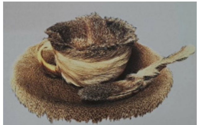
تصویر ۵: مرت اوپنهایم، ابژه (صبحانه پشمی)، ۱۹۳۶، پشم آهو (George, 2014: 59)

در ادامه و روندی که تا کنون ذکر آن رفت، لازم است به جنبش نئودادا ۲۱ پرداخته شود؛ جنبشی که انگیزه اصلی‌اش، آفریدن آثاری با روح جهانی بود که در آن‌ها بتوان اشیاء و فرم‌های مربوط به واقعیت و زندگی روزمره را تلفیق کرد. در واقع نظریه این جنبش بر آن بود که شکل تازه‌ای از منظره را دریابد؛ منظره‌ای که با اشیاء متروکه و پسماندهای دنیای اطراف که به واسطه انسان‌ها و فرآیند صنعتی شدن به کلی تغییر کرده‌اند و ضایعات تلنبار شده در زباله‌دان‌های عظیم شهرها آن را به وجود آورده‌اند. چنین مواد دورریختنی و ضایعاتی نزد پیروان نئودادا می‌توانست در آثار هنری به کار رود. رابرت راشنبرگ ۲۲ ، از اعضای اصلی این جنبش، در نقاشی‌های ترکیبی ۲۳ خود با استفاده از رسوبات و پسماندها در نقاشی، اشیاء بسیار ناهمخوان را با شیوه اجرایی که به روشنی از دادا نشأت گرفته بود، روی بوم گرد هم می‌آورد که یادآور حاضرآماده‌های