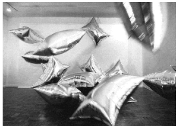
تصویر ۷: اندی وارهول، بالش‌های نقره‌ای ۴۷ ، ۱۹۶۰، پلاستیک‌فیلم متالیزه، پرشده با اکسیژن و هلیوم، ابعاد هر کدام ۹۱ × ۱۳۰ سانتی‌متر (Collins, 2007: 10)