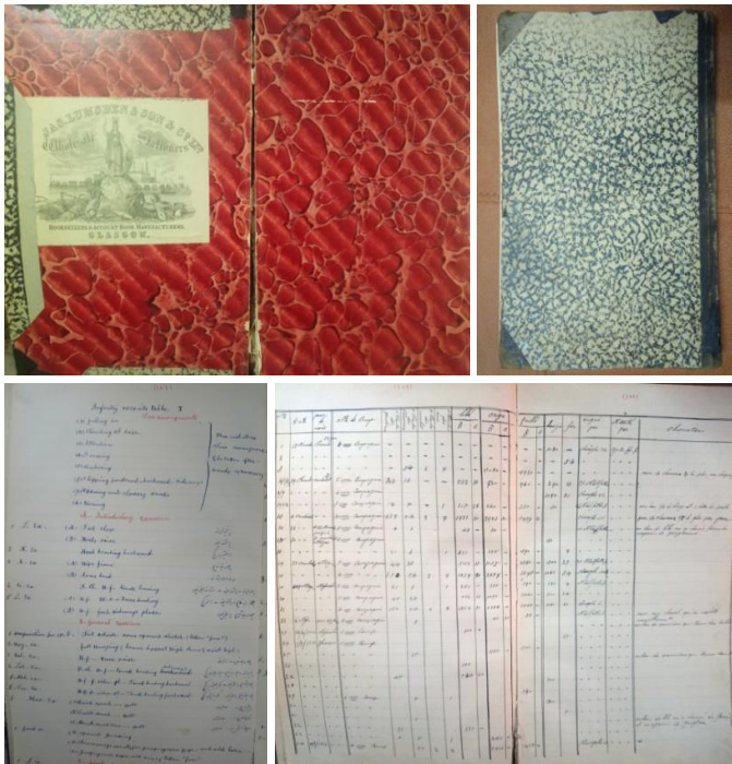
تصویر ۱ تا ۴)

رو و توی جلد و برگهایی از سند خطی خانوادگی مورد تحقیق