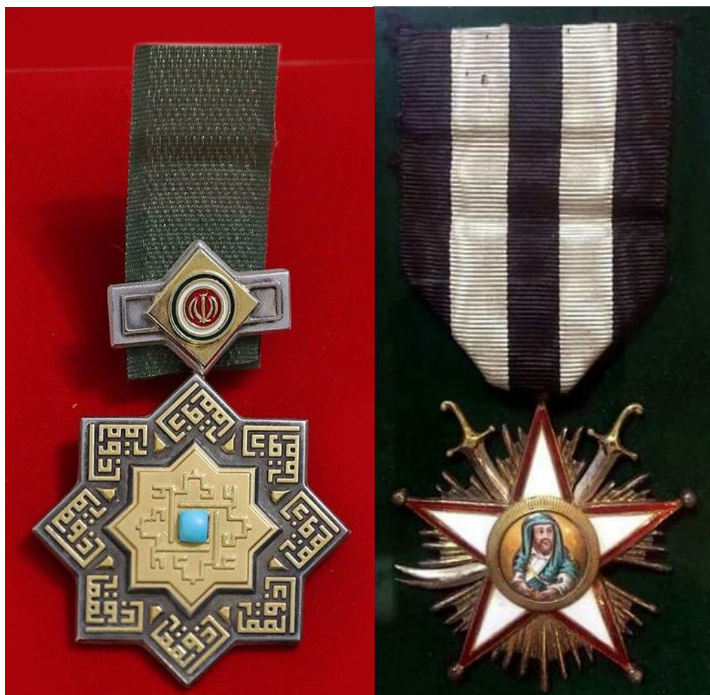
تصویر ۳) نشان ذوالفقار در عصر قاجار و پهلوی (سمت راست، مأخذ: مجموعه خصوصی) و نشان ذوالفقار پس از انقلاب اسلامی (سمت چپ، مأخذ: وبگاه اطلاع‌رسانی دفتر حفظ و نشر آثار آیت‌الله‌العظمی سید علی خامنه‌ای)