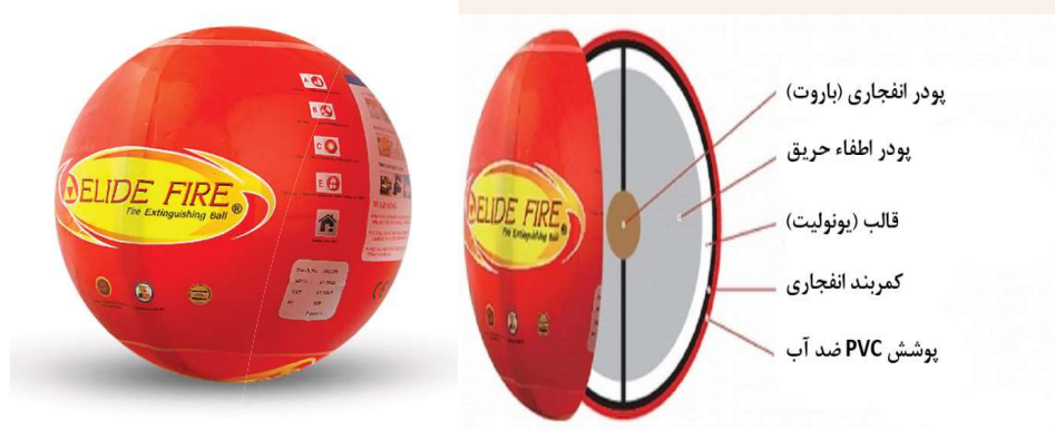
شکل ۶ - ساختار توپ های ضد حریق [۱۱]

در شکل زیر ساختار کلی توپ های ضد حریق را نشان داده شده است.