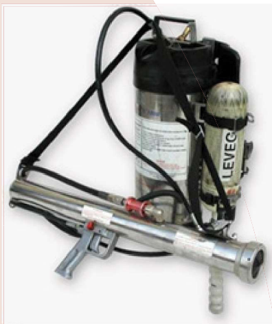
شکل ۴- تفنگ های هوای فشرده IFEX ۳۰۰۰ [۹]

می نامند و IFEX ۳۰۰۰ این وسیله آتش نشانی دقیقاً شبیه اسلحه است اما در برخورد با آتش سوزی خطرناک فوق العاده مؤثر است. آن را از سال ۱۹۹۴ توسط آتش نشانان در آلمان مورد استفاده قرار گرفته است. این تکنولوژی از مقدار کمی آب که با سرعت بالا شلیک می‌شود برای خاموش کردن آتش استفاده می‌کند. قطرات آبی که در اثر انفجارهای بخار شلیک می‌شوند می‌توانند تا ۱۲۰ متر در ثانیه حرکت کنند و باعث ایجاد یک اثر خنک کننده قوی شده که عامل موفقیت این سیستم است. این سیستم در قالب دستی، کوله پشتی، موتور سیکلت، تراکتور، هلی کوپتر و غیره کاربری دارد.