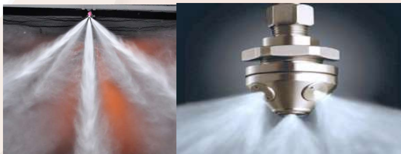
شکل ۱- نمونه سیستم های مه-آب [۵]

از محدودیت های این تکنولوژی می توان به این نکات اشاره کرد که در برخی موارد ذرات مه-آب شبیه گاز عمل کرده و بسته به اندازه، ویژگی و طرح داخلی ساختمان باید تهویه مناسب ساختمان همیشه مد نظر قرار گیرد. همچنین با آنکه استفاده از مه-آب برای محافظت منطقه نسبت به سیستم های اطفای حریق گازی کمتر در معرض نشستی قرار دارد، اما این در مسئولیت نصاب است که حجم نشستی قابل قبول را برای هر ناحیه بر اساس تست های انجام شده مشخص سازد.