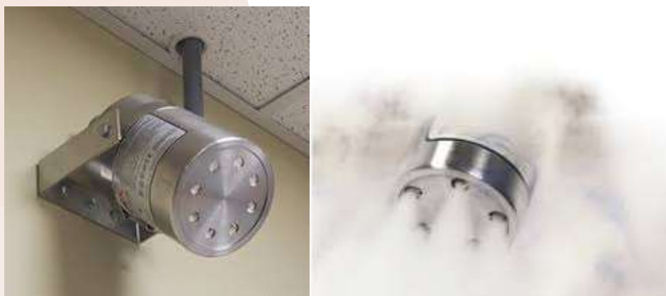
شکل ۲- نمونه سیستم های ابروسل [۷]

سیستم اطفای حریق ابروسل سیستم مه‌ار کننده آتش بر پایه ذرات جامد کوچکتر از ۱۰ میکرومتر و گاز می‌باشد. ذرات جامد غیرسمی بوده و تا زمانی که فعال نشده است پایدار می‌ماند و در صورت فعال شدن ترکیبی از پودر و گاز (آبروسل) با خاصیت خاموش کنندگی تولید می‌نماید. مکانیزم اطفاء حریق در این تکنولوژی بدین صورت است که یک ماده شیمیایی جامد پس از فعالسازی، که می‌تواند به صورت الکتریکال، مکانیکال و یا حرارتی باشد، مخلوطی از گاز (اکثرا دی‌اکسید کربن، نیتروژن و بخار آب) و پودر میکرونی خشکی (اکثرا کربنات‌های پتاسیم) ایجاد کرده و ابروسل حاصل به منطقه تحت پوشش وارد می‌شود. ذرات ابروسل از یک خنک کننده شیمیایی عبور نموده و دمای ابروسل را به نحو مطلوبی کاهش می‌دهد. از فواید این روش می‌توان به سادگی و راه اندازی مجدد سریع، غیر سمی بودن، عدم کاهش سطح اکسیژن در محیط، مقرون به صرفه بودن، سازگار بودن با محیط زیست و ... اشاره کرد. این سیستم بیشترین کاربرد را در اتاق های اسناد کاغذی، انبارهای چوب و پارچه، اتاق های برق و اتاق های دیزل و سوخت دارد.