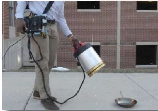
شکل ۳- اطفاء حریق با امواج صوتی [۸]

دو دانشجوی مهندسی دانشگاه جورج میسون که معتقد بودند امواج صوتی قابلیت کاهش حجم آتش را دارند توانستند آتش را به کمک امواج صوتی خاموش کنند. مکانیزم این سیستم بدین صورت است که به کمک امواج صوتی اکسیژن را از آتش دور شده و آتش خاموش می‌شود. آنها به این نتیجه رسیدند که امواج در محدوده ۳۰ تا ۶۰ هرتز که در محدوده فرکانس پایین قرار دارد، بهترین رفتار اطفای حریق را ارائه می‌دهد. این وسیله از سه بخش تقویت کننده، منبع قدرت و موازی ساز تشکیل شده است. یکی از معایب این تکنولوژی این است که پس از اطفای حریق جسم تا مدتی داغ خواهد بود. چون در این فرایند، برخلاف آب که گرما را از آتش حذف می‌کند اکسیژن را از آتش حذف شده است [۸].