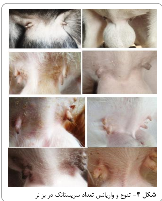
شکل ۴- تنوع و واریانس تعداد سرپستانک در بز نر

همخونی در ارتباط بوده است (Oppong and Gumedze, 1982) و این اتفاق با افزایش اندازه گله کاهش یافته است (Akpa et al. , 2010). که وراثت پذیر بودن صفت را ثابت می کند (Kenny, 2014).