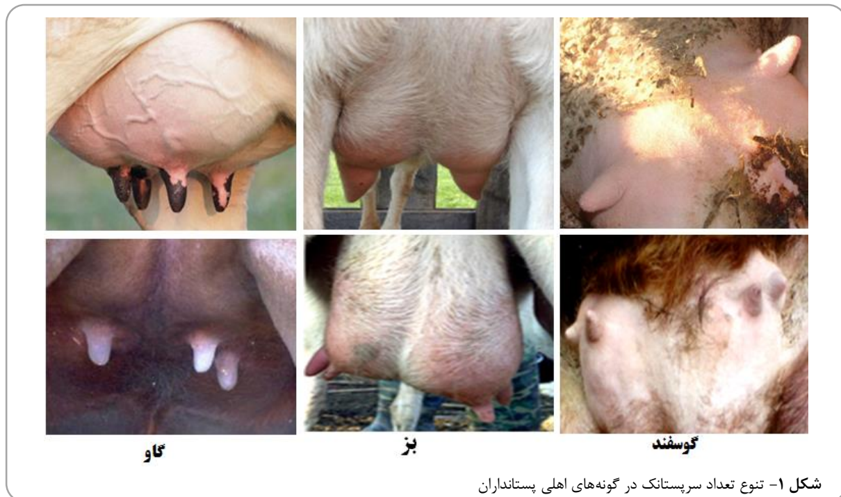
شکل ۱- تنوع تعداد سرپستانک در گونه‌های اهلی پستانداران

چند سرپستانکی، نوعی نقص مادرزادی و ارثی در غدد پستانی بسیاری از پستانداران از جمله گاو، گوسفند و بز است. تعداد سرپستانک در پستانداران، از یک تا ۱۸ عدد متغیر است. در این میان گونه خوکسانان با ۱۸ و کیسه‌دار Virginia Opossum با ۱۳ عدد سرپستانک به ترتیب مقام اول و دوم را به خود اختصاص داده‌اند. می‌توان عنوان کرد که افزایش تعداد سرپستانک پاسخی در قبال افزایش چندقلوزایی در این حیوانات است؛ چرا که حیواناتی که در هر زایش تعداد فرزندان بیشتری را به دنیا می‌آورند، به صورت ژنتیکی تعداد سرپستانک بیشتری برای تغذیه فرزندان خود نیاز دارند. تعداد سرپستانک مورد انتظار در گونه‌های مختلف پستانداران عدد استاندارد ثابتی را دارد، به طوری که در بز، گوسفند و اسب دو عدد، گاو و شتر چهار عدد،