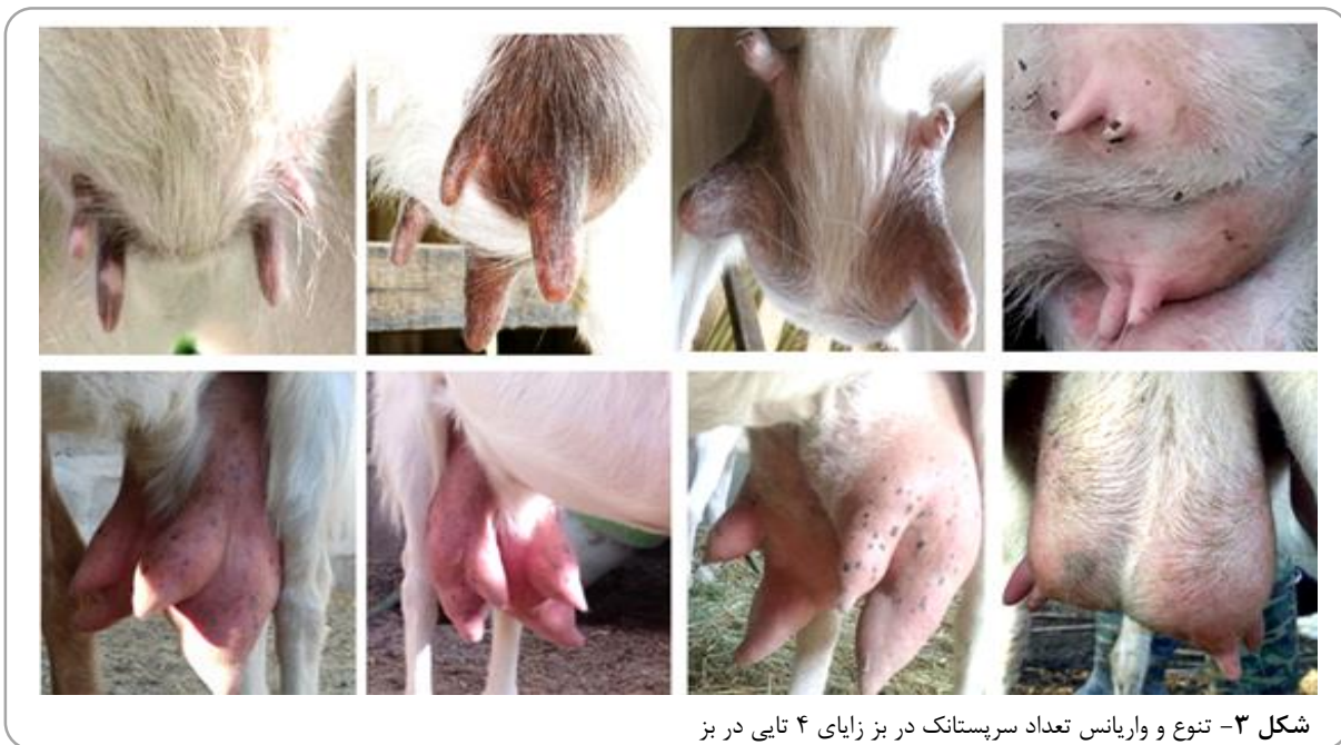
شکل ۳- تنوع و واریانس تعداد سرپستانک در بز زایای ۴ تایی در بز

همخونی در ارتباط بوده است (Oppong and Gumedze, 1982) و این اتفاق با افزایش اندازه گله کاهش یافته است (Akpa et al. , 2010). که وراثت پذیر بودن صفت را ثابت می کند (Kenny, 2014).