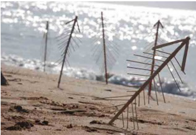
شکل ۲. ماهی‌ها، کریم اله‌خانی، جزیره هرمز، ایران، ۱۳۸۷ ه.ش/ ۲۰۰۹ م. (۱ Url).