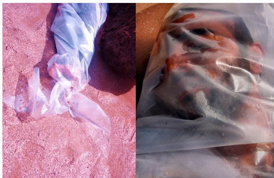
شکل ۶. مرد- ماهی، فرشته عالمشاه، جزیره هرمز، هرمز، ایران، ۱۳۸۷ ه.ش/ ۲۰۰۹ م. (Url ۸).

سه اثر «مرد- ماهی»، «زن- ماهی» و «دام صخره ماهی» با توجه به مشابهت در موقعیت جغرافیایی، فرم، مواد به کار گرفته‌شده و انتقال مفهوم یکسان، همزمان مورد مطالعه قرار می‌گیرند. دو اثر نخست، همان‌گونه که در شکل‌های (۶ و ۷) قابل مشاهده است و همچنین بر مبنای نام اثر، مرد و زنی را که درون کیسه‌های پلاستیکی پیچیده شده‌اند، در سواحل جنوبی کشور نمایش می‌دهند. عالمشاه در اثر «مرد- ماهی»، مرگ انسانی ماهی‌گون را روی ساحل سرخ‌رنگ که کوچک‌ترین نشانی از خشکی و بی‌آبی در آن رویت نمی‌شود، به تصویر کشیده است. این هنرمند، در اثر «زن- ماهی» نیز ماهی بی‌جانی را که در قاب تصویر آن به وضوح موج کوچکی از دریا نمایان می‌باشد، بازتاب نموده است. عالمشاه همچنین در «دام