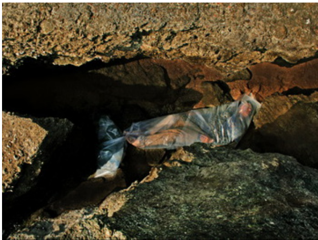
شکل ۸. دام صخره ماهی، فرشته عالمشاه، جزیره هرمز، ایران، ۱۳۸۷ ه.ش/ ۲۰۰۹ م. (Url ۸).

زیست‌محیطی تلقی می‌گردند، استفاده نموده است. از طرفی، عامل دیگری که در سه اثر «مرد- ماهی»، «زن- ماهی» و «دام صخره ماهی»، در چشم مخاطب نمایان می‌گردد، بهره‌مندی از نشانه ماهی است که ایفاگر آن یک انسان در هیئت مرد و زن می‌باشد. در حقیقت، ماهی می‌تواند به عنوان نماینده جانوران آبی و پلاستیک به عنوان نماینده آلاینده‌های آبی لحاظ گردند. از این رو، آثار مورد نظر، انعکاس‌دهنده نکات مهمی به مخاطب می‌باشند؛ موجودات دریایی در غالب مواقع، کیسه پلاستیکی را اشتباهاً به جای طعمه اصلی و واقعی خود فرض نموده و در اثر بلعیدن آن، با مرگ‌ومیر مواجه می‌شوند. از سوی دیگر، برخی از گونه‌های آبی، در طول مسیر دریایی به طور ناگهانی در برابر این آلاینده که در حکم تله برای آنها به شمار می‌آید، گرفتار شده و موجب خفگی یا فرو رفتن آنها در آب و در نتیجه، حذف یا انقراض برخی آبزیان می‌گردد.