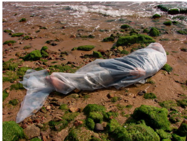
شکل ۷. زن- ماهی، فرشته عالمشاه، جزیره هرمز، ایران، ۱۳۸۷ ه.ش/ ۲۰۰۹ م. (Url ۸).

زیست‌محیطی تلقی می‌گردند، استفاده نموده است. از طرفی، عامل دیگری که در سه اثر «مرد- ماهی»، «زن- ماهی» و «دام صخره ماهی»، در چشم مخاطب نمایان می‌گردد، بهره‌مندی از نشانه ماهی است که ایفاگر آن یک انسان در هیئت مرد و زن می‌باشد. در حقیقت، ماهی می‌تواند به عنوان نماینده جانوران آبی و پلاستیک به عنوان نماینده آلاینده‌های آبی لحاظ گردند. از این رو، آثار مورد نظر، انعکاس‌دهنده نکات مهمی به مخاطب می‌باشند؛ موجودات دریایی در غالب مواقع، کیسه پلاستیکی را اشتباهاً به جای طعمه اصلی و واقعی خود فرض نموده و در اثر بلعیدن آن، با مرگ‌ومیر مواجه می‌شوند. از سوی دیگر، برخی از گونه‌های آبی، در طول مسیر دریایی به طور ناگهانی در برابر این آلاینده که در حکم تله برای آنها به شمار می‌آید، گرفتار شده و موجب خفگی یا فرو رفتن آنها در آب و در نتیجه، حذف یا انقراض برخی آبزیان می‌گردد.