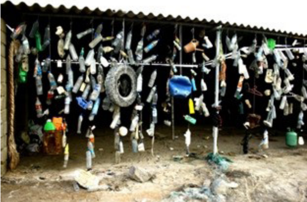
شکل ۴. زباله‌های ساحلی، فرشته زمانی و ساناز غلامی، جزیره هرمز، ایران، ۱۳۸۷ ه.ش/ ۲۰۰۹ م. (۴Url).