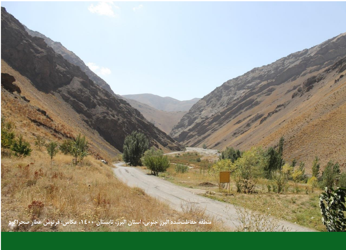
منطقه حفاظت‌شده البرز جنوبی، استان البرز، تابستان ۱۴۰۰