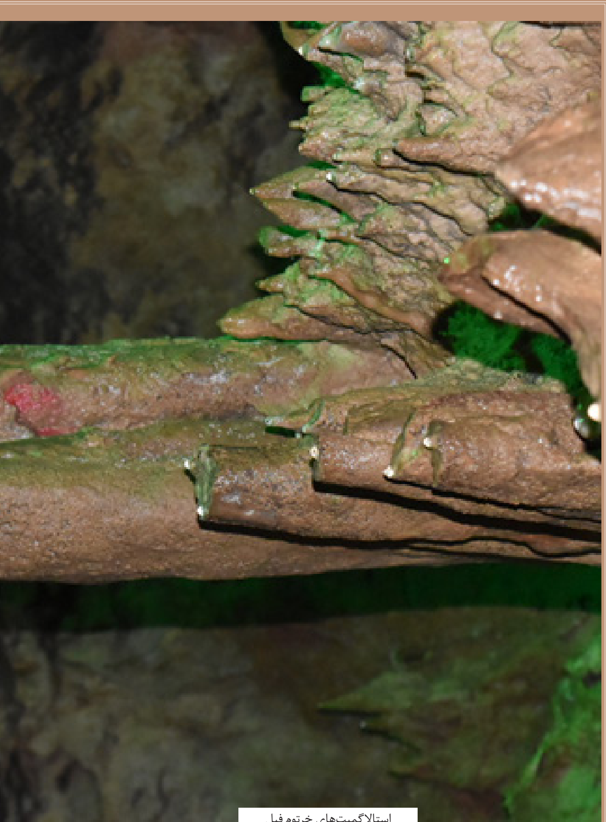
استلاگمیت‌های خرتوم فیل