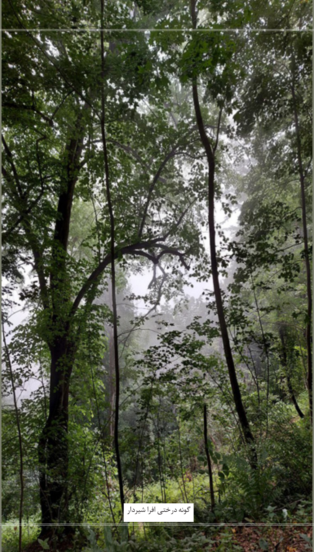
گونه درختی افرا شیردار