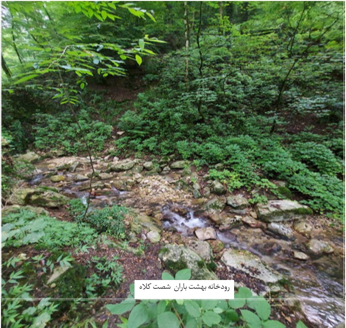
رودخانه بهشت باران شصت کلاه

این منطقه بعد از پارک ملی گلستان، بزرگترین منطقه حفاظت شده استان گلستان است. جهان نما زیباترین و بکرترین جنگل های میان بند در شمال ایران را دارد که سبب جذب گردشگران و کوهنوردان زیادی از اقصی نقاط کشور شده است و به دلیل ارتفاع زیادش به آن بام استان گلستان نیز اطلاق می شود و در ارتفاعات آن می توان طلوع و غروب خورشید به صورت واضح و همچنین دریای ابر را دید، بنده تجربه ۳ بار رفتن به این منطقه حفاظت شده را دارم. رودخانه بهشت باران شصت کلاه گونه درختی مرمرز و افرا شیردار منطقه صندوق پشت جهان نما