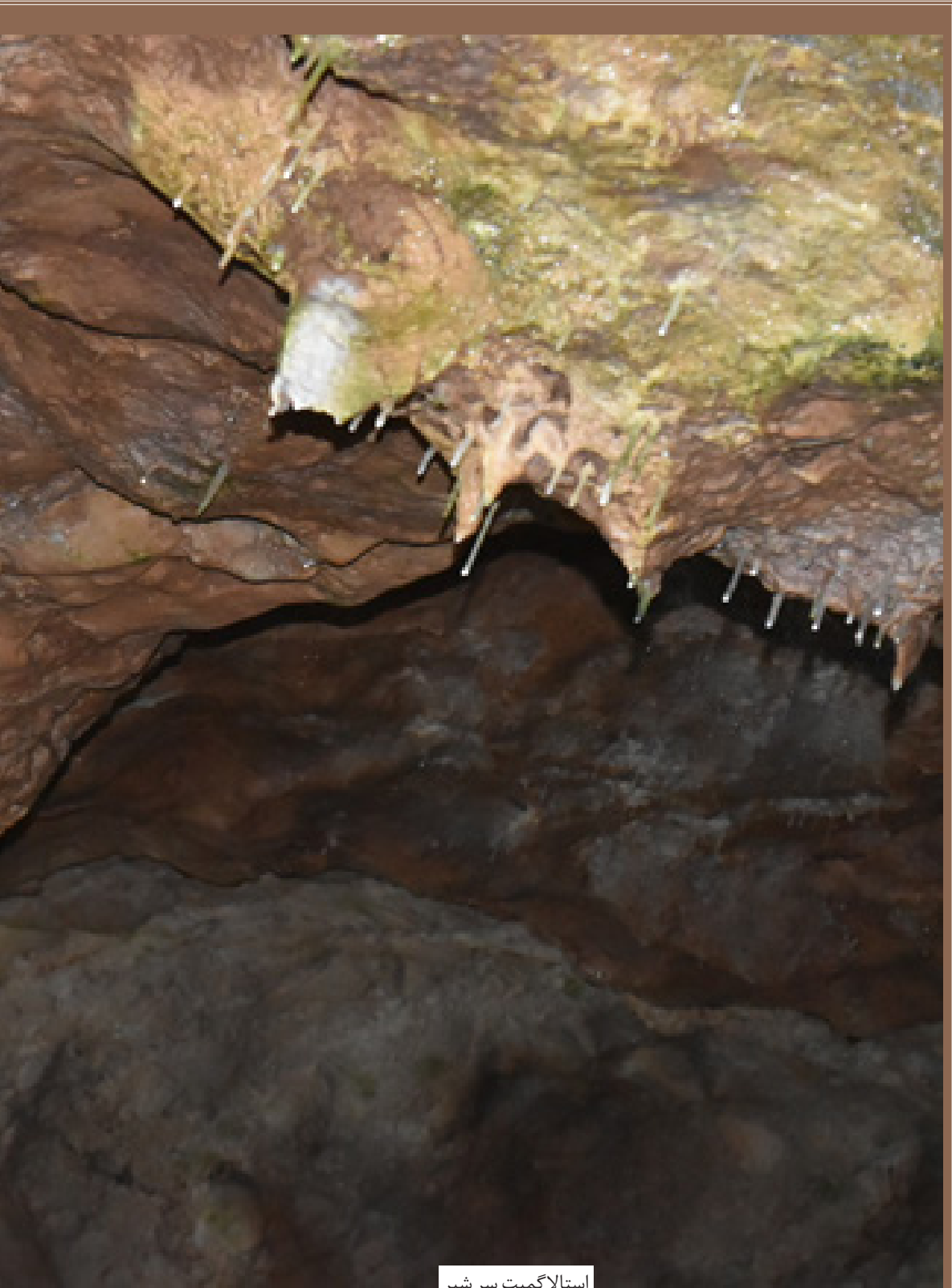
استالاگمیت سر شیر