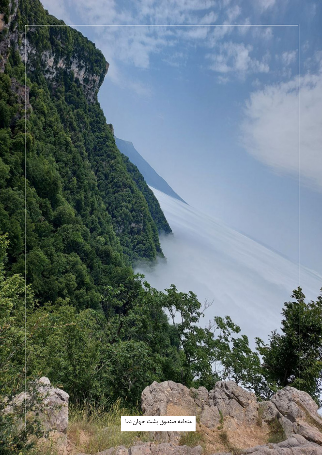
منطقه صندوق پشت جهان نما