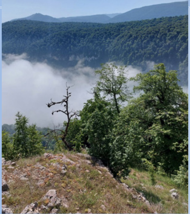
گونه درختی ممرز