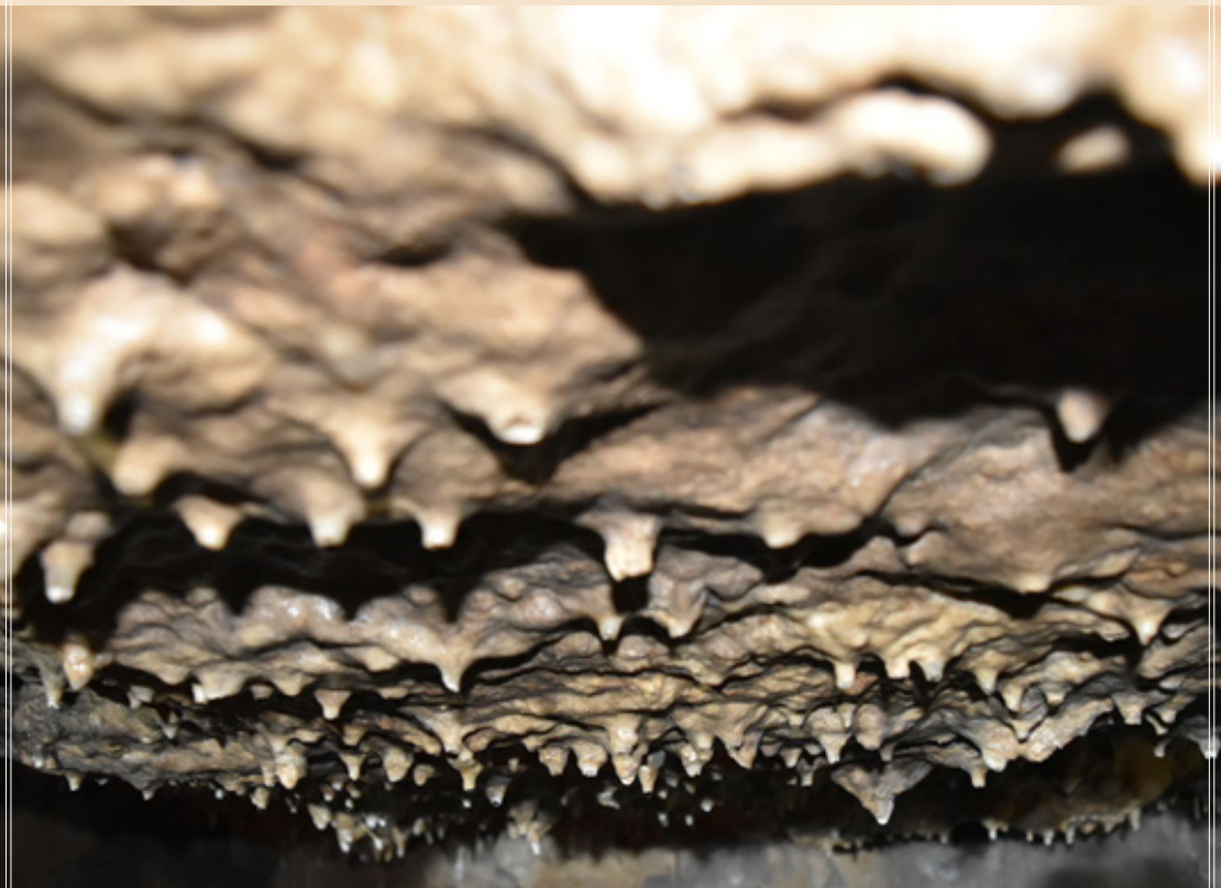
استالاکمیت‌های سقف غار

در بازدید از مجموعه قوری قلعه که بزرگترین غار آبی خاورمیانه با پیشینه ۶۵ میلیون سال است، متوجه موضوعاتی از جمله وجود لامپ‌های گرمایی در غار شدم. وجود این لامپ‌ها باعث ایجاد خزه‌های سبزرنگ در دیواره غار شده که به مرور به درون بافت آهکی دیواره نفوذ و باعث خرد شدن آن می‌شود. لازم به ذکر است ۳۱۴۰ متر از درازای غار کشف شده اما فقط ۴۵۰ متر قابل بازدید بوده و سازمان محیط زیست و میراث فرهنگی اقدامی برای ساخت و ساز باقی مانده قسمت کشف شده نکرده است. همچنین پس از اکتشاف تالار عروس، اقدام اکتشافی دیگری روی غار صورت نگرفته است.